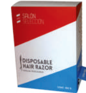
100 Uds. / Cód.: V4171