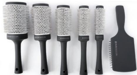
(65 mm.) / Cód.: 290-BN (53 mm.) / Cód.: 291-BN (43 mm.) / Cód.: 292-BN (32 mm.) / Cód.: 293-BN (25 mm.) / Cód.: 294-BN Cód.: 296SS