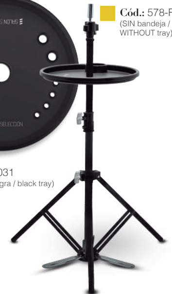
Cód.: 578-R (SIN bandeja / WITHOUT tray)