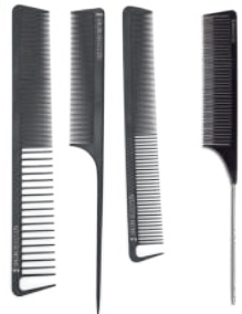
Cód.: 42P / 45P / 41P / 1443