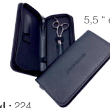
5,5 " entresacar / Cód.: 763SN 5 " / Cód.: 765SN 5,5 " / Cód.: 759SN 6 " / Cód.: 764SN 7 " / Cód.: 766SN