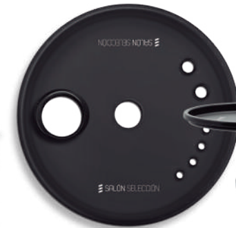
Cód.: V6031 (bandeja negra / black tray)