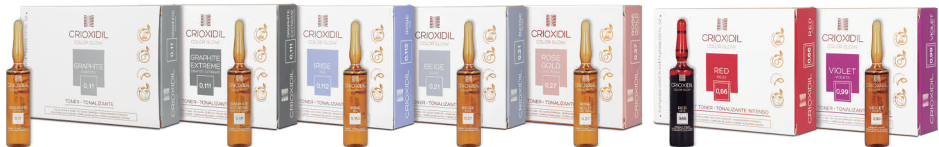
Graphite 0,11 Cód.: TCTGRAF

Cantidad: 3 x 15 ml / 0.51 fl. oz. · Unidad caja: 8 u. / caja-box-caixa