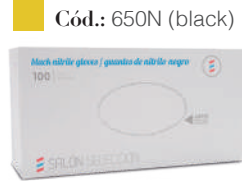
Cód.: 650N (black)